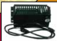
Ventilateur / Blower

Grande chambre à combustion / Large firebox